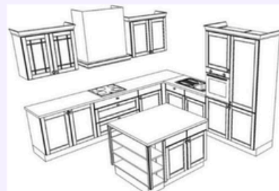
Type de cuisine 3