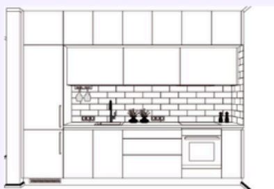
Type de cuisine 8