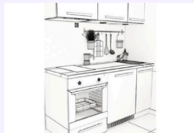
Tipo di cucina 9