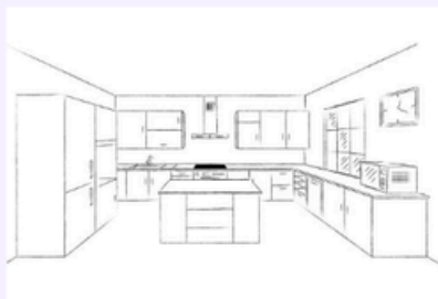
Tipo di cucina 1

Scelga il tipo di cucina che più si avvicina alla sua. La disposizione, lo stile e i materiali dei mobili o delle superfici non sono rilevanti. Tutte le misure illustrate sono solo stime approssimative.