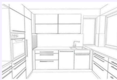
Tipo di cucina 2