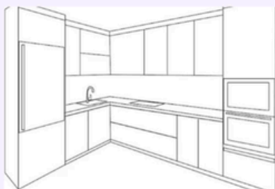
Tipo di cucina 4