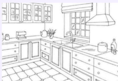
Tipo di cucina 5