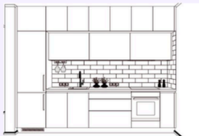
Tipo di cucina 8