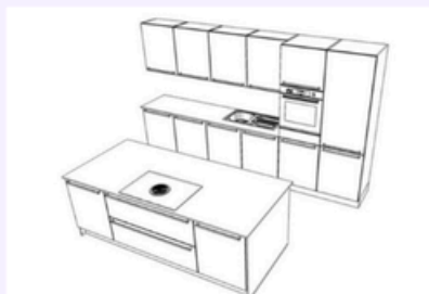
Tipo di cucina 7